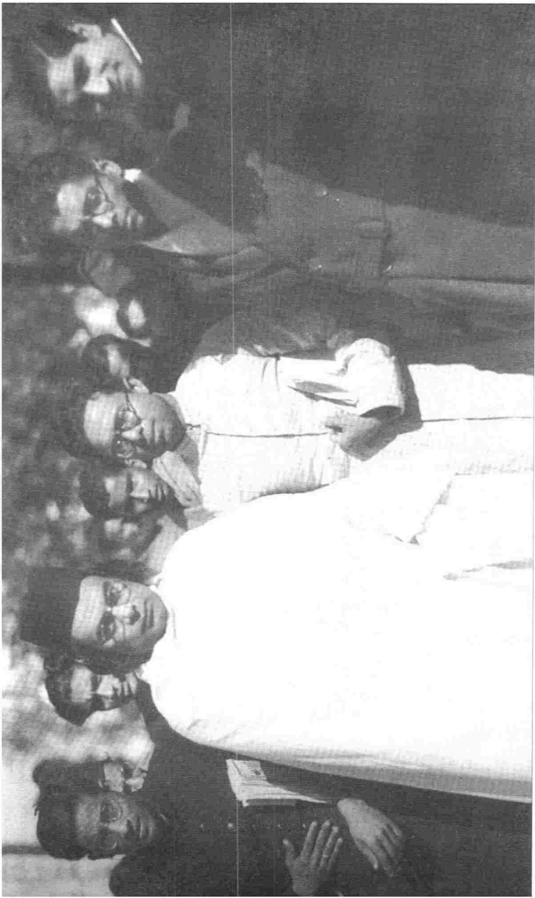
বঙ্গীয় মুসলমান সাহিত্য সম্মেলনের অনুষ্ঠানে নজরুল